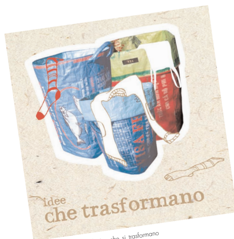
Imballaggi e sacchi di riso che si trasformano in simpatiche e utili borse e accessori