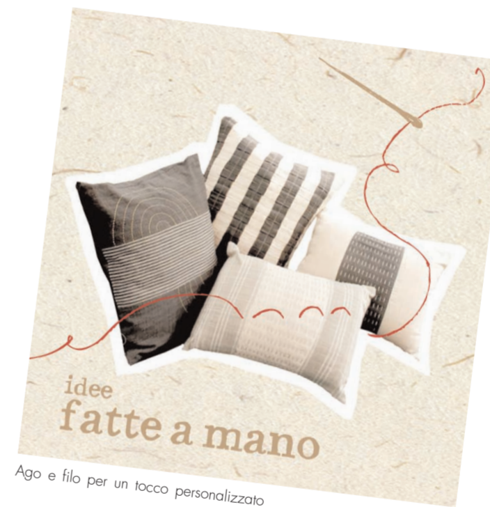
Ago e filo per un tocco personalizzato

Acquista dal commercio equo e solidale, e acquisti giusto!