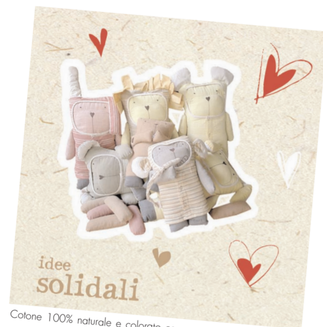
Cotone 100% naturale e colorato con processo naturale