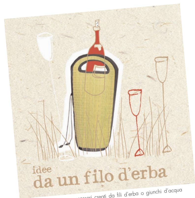
Portabottiglie, borse e accessori creati da fili d'erba o giunchi d'acqua

ACCESSORI ABBIGLIAMENTO ARTICOLI BAMBINI DECORAZIONI TAVOLA HOME DECOR BOMBONIERE REGALI AZIENDALI